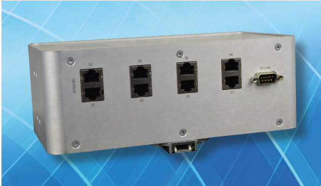
Detailansicht der Unterseite mit Sensorm Schnittstellen mit Ethernet und CAN-Bus.